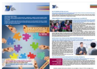
Časopis Zařízení služeb Ministerstva vnitra

Pro potřeby klientů i pro potřeby vlastní připravujeme různé typy časopisů a e-newsletterů: