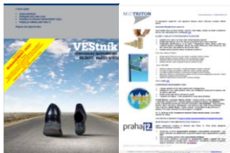
VEStník – zpravodaj pro veřejnou správu